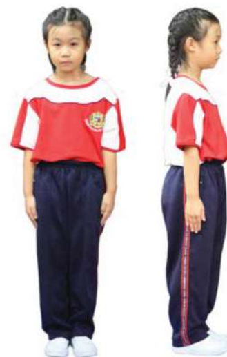
เครื่องแต่งกายชุดพลศึกษานักเรียนหญิง ชั้นประถมศึกษาปีที่ 1 - 3