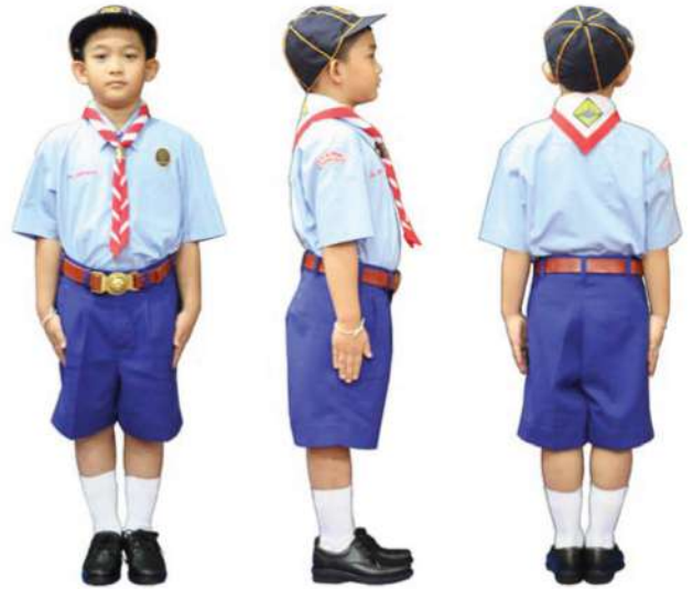
เครื่องแต่งกายลูกเสือสำรอง ชั้นประถมศึกษาปีที่ 1 - 3