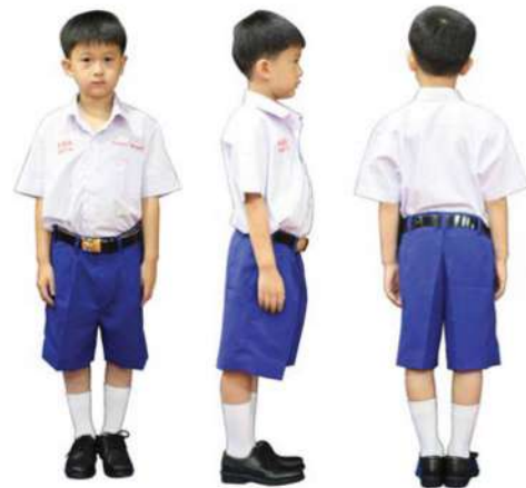
เครื่องแต่งกายชาย ชั้นประถมศึกษาปีที่ 1 - 3

1.6 ทรงผม ทรงนักเรียน ทรงอเมริกัน หรือ รองทรง (ตีนผมด้านข้างและด้านหลังต้องตัดให้ติดหนังศีรษะ ห้ามไว้จอนหรือปล่อยตีนผมแบบรอกไทร ส่วนยาวของผม ด้านหน้าต้องไม่ยาวเกินระดับคิ้วลงมา และห้ามใส่น้ำมันหรือเครื่องสำอางใดๆ