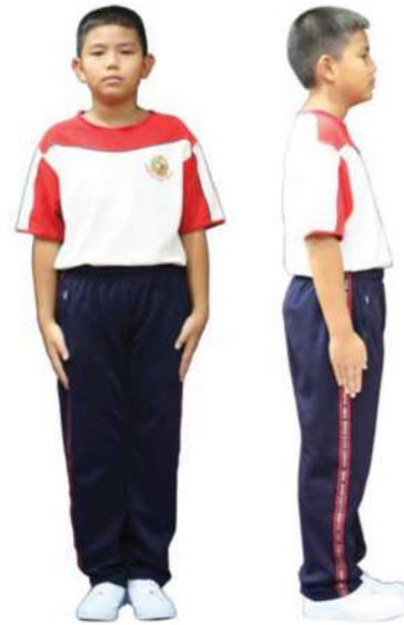
เครื่องแต่งกายชุดพลศึกษานักเรียนชาย ชั้นประถมศึกษาปีที่ 4 - 6

2.5.2 ผมยาว ให้ถักเปียสองข้าง ปล่อยปลายผมยาว 3 นิ้ว รัดด้วยหนังยางสีดำ และผูกริบบิ้นเนื้อเรียบไม่มีลวดลาย ขนาด 1 – 1.15 นิ้ว สีขาว สีดำ หรือสีกรมท่า (สีเดียวกับกระโปรง) ผมด้านหน้าติดกับขนาดเล็กสีดำ ไม่ให้ไว้ผมหน้าม้า เปิดหน้าผาก ผมด้านข้างติดกับเก็บผมให้เรียบร้อย ห้ามซอยผม ตัดผม กัดสีผม ย้อมผม สไลด์ผม ไม่ใช้สเปรย์ หรือเจลยกผมด้านหน้าสูง ที่คาดผม หวีสับ หรือเครื่องประดับอื่น