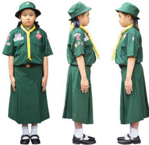
เครื่องแต่งกายเนตรนารีสามัญ ชั้นประถมศึกษาปีที่ 4 - 6