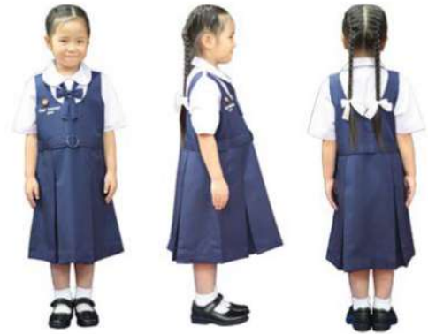
เครื่องแต่งกายผู้หญิง ชั้นประถมศึกษาปีที่ 1 - 3

กระโปรงเป็นชุดเอี๊ยมสีกรมท่า ตามแบบของโรงเรียน ความยาวคลุมเข่า ด้านข้างซ้าย ติดซิปปยาว มีกระเป๋าสีเสื้อด้านข้างขวา กระโปรงจับทวิสด้านหน้าและด้านหลัง ด้านละสองจีบ เหนือเอวขึ้นไปถึงหน้าอก เย็บเกล็ด 2 ข้าง ปลายบาน บริเวณเอวมีเข็มขัดติดตายตัว ที่หน้าอกด้านขวา ปักชื่อ – สกุล ขนาดตัวอักษร 0.5 เซนติเมตร และเลขประจำตัวขนาด 1 เซนติเมตร ด้วยไหมสีขาว