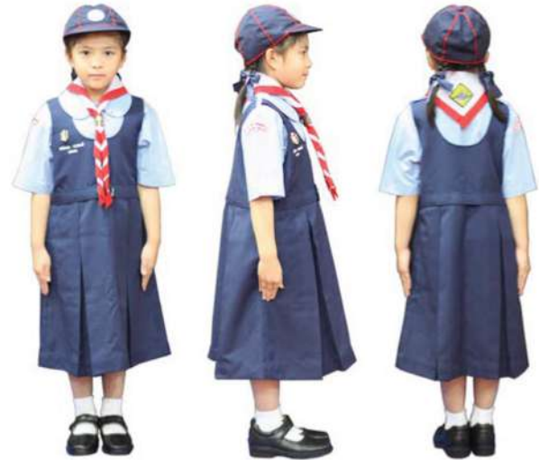
เครื่องแต่งกายเบตนารีสำรอง ชั้นประถมศึกษาปีที่ 1 - 3