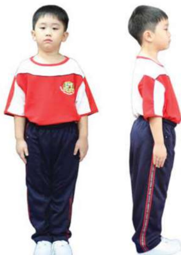
เครื่องแต่งกายชุดพลศึกษานักเรียนชาย ชั้นประถมศึกษาปีที่ 1 - 3