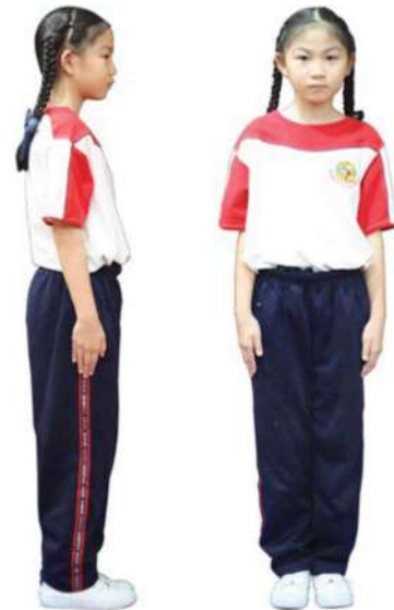
เครื่องแต่งกายชุดพลศึกษานักเรียนหญิง ชั้นประถมศึกษาปีที่ 4 - 6