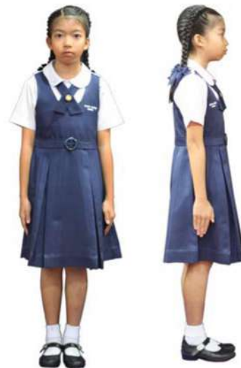
เครื่องแต่งกายผู้หญิง ชั้นประถมศึกษาปีที่ 4 - 6