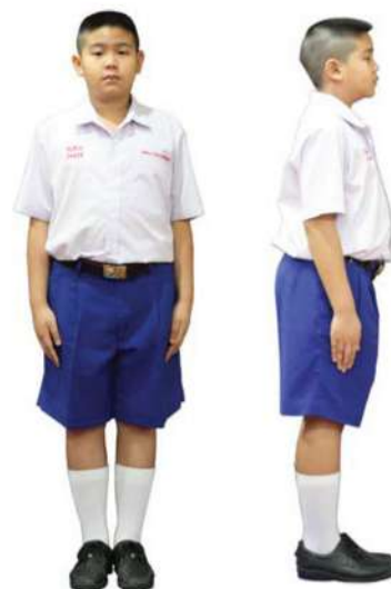
เครื่องแต่งกายชาย ชั้นประถมศึกษาปีที่ 4 - 6