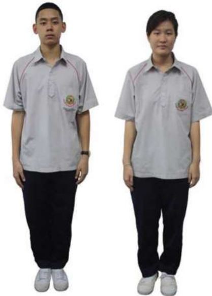
เครื่องแต่งกายชุดพลศึกษานักเรียนชาย-หญิง ชั้นมัธยมศึกษาปีที่ 4 - 6