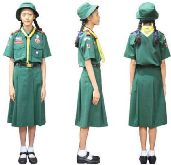
เครื่องแต่งกายเนตรนารีสามัญรุ่นใหญ่

5.7 รองเท้า รองเท้านักเรียนหนังเรียบสีดำล้วน ไม่มีลวดลาย ไม่มีเชือกผูก และมีรูปทรงตามที่โรงเรียนกำหนด