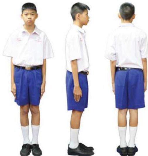
เครื่องแต่งกายนักเรียนชาย ชั้นมัธยมศึกษาปีที่ 1 - 3

ขนาดตัวอักษร 0.5 นิ้ว และเลขประจำตัว ขนาด 1 เซนติเมตร ด้วยไหมสีแดง ที่ปลายปกเสื้อด้านขวา ปักดาวด้วยไหมสีน้ำเงิน ชั้นมัธยมศึกษาปีที่ 4 ปักดาว 1 ดวง ชั้นมัธยมศึกษาปีที่ 5 ปักดาว 2 ดวง และชั้นมัธยมศึกษาปีที่ 6 ปักดาว 3 ดวง มีเนคไทสีกรมท่า สีเดียวกับกระโปรง ปลายตัดตามแบบของโรงเรียน ผูกพอดีคอเสื้อและติดเข็ม วิทยฐานะให้ตรงกับกระดุมเสื้อเม็ด ที่ 3 เมื่อผูกเนคไท ให้ความยาวเสมอ ขอบเข็มขัดด้านบน เวลาสวมให้นำชาย เสื้อไว้ในกระโปรง และใส่เสื้อทับเต็มตัว ทุกครั้ง