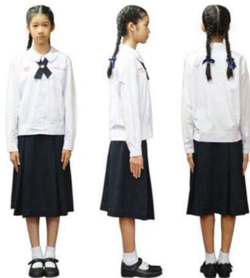
เครื่องแต่งกายนักเรียนหญิง ชั้นมัธยมศึกษาปีที่ 1 - 3