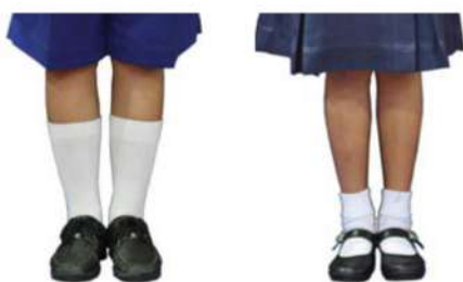
รองเท้า-ถุงเท้านักเรียนชาย-หญิง

2.5 ถุงเท้า สีขาวเรียบแบบนักเรียน ไม่มีลวดลาย ไม่มีแถบสี และให้พับขอบไว้เหนือตาตุ่ม ห้ามใช้ถุงเท้าลูกฟูกชนิดหนาหรือบางคล้ายถุงน่อง