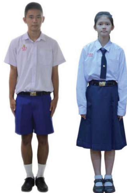
เครื่องแต่งกายนักเรียนชาย-หญิง ชั้นมัธยมศึกษาปีที่ 4 - 6

1.6 ทรงผม ทรงนักเรียน ทรงอเมริกัน หรือทรงทรง (ตีนผมด้านข้างและด้านหลังต้องตัดให้ติดหนังศีรษะ ห้ามไว้จอนหรือปล่อยตีนผมแบบบรากไทโร ส่วนยาวของผม ด้านหน้าต้องไม่ยาวเกินระดับคิ้วลงมา) และห้ามใส่น้ำมันหรือเครื่องสำอางใดๆ