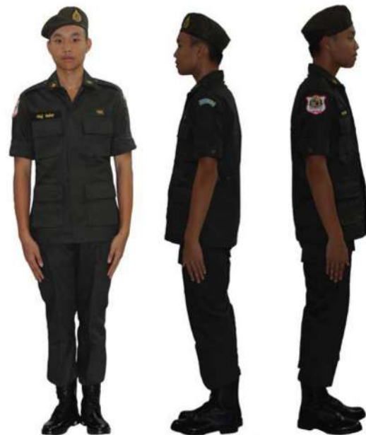
เครื่องแต่งกายนักศึกษาวิชาทหาร ชั้นมัธยมศึกษาปีที่ 4 - 6