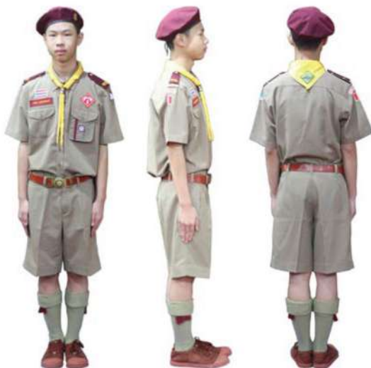
เครื่องแต่งกายลูกเสือสามัญรุ่นใหญ่