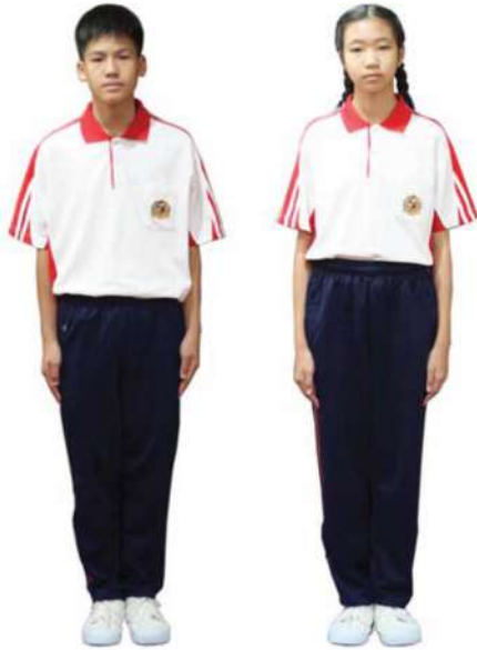
เครื่องแต่งกายชุดพลศึกษานักเรียนชาย-หญิง ชั้นมัธยมศึกษาปีที่ 1 - 3