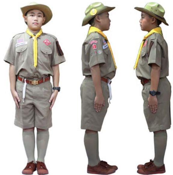
เครื่องแต่งกายลูกเสือสามัญ ชั้นประถมศึกษาปีที่ 4 - 6