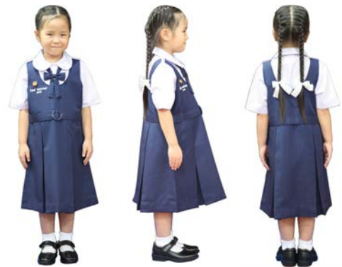
เครื่องแต่งกายผู้หญิง ชั้นประถมศึกษาปีที่ 1 - 3

กระโปรงเป็นชุดเอี๊ยมสีกรมท่า ตามแบบของโรงเรียน ความยาวคลุมเข่า ด้านข้างซ้ายติดซิปปยาว มีกระเป๋าสีเสื้อด้านขวา กระโปรงจีบทวิสด้านหน้าและด้านหลัง ด้านละสองจีบ เหนือเอวขึ้นไปถึงหน้าอก เย็บเกล็ด 2 ข้าง ปลายบาน บริเวณเอวมีเข็มขัดติดตายตัว ที่หน้าอกด้านขวา ปักชื่อ – สกุล ขนาดตัวอักษร 0.5 เซนติเมตร และเลขประจำตัวขนาด 1 เซนติเมตร ด้วยไหมสีขาว