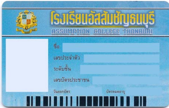
ตัวอย่างบัตรด้านหน้า

เปิดให้บริการ วันจันทร์ - วันศุกร์ เวลา 07.10 – 16.00 น. วันเสาร์ เวลา 07.30 – 15.30 น.