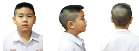
ทรงผมชาย ชั้นประถมศึกษาปีที่ 4 - 6