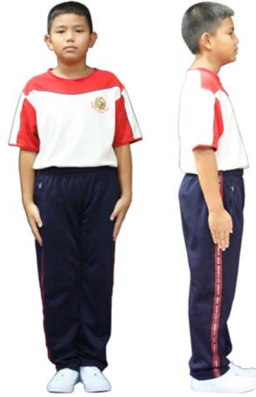
เครื่องแต่งกายชุดพลศึกษา นักเรียนชาย ชั้นประถมศึกษาปีที่ 4 - 6

2.5.2 ผมยาว ให้ถักเปียสองข้าง ปล่อยปลายผมยาว 3 นิ้ว รัดด้วยหนังยางสีดำ และผูกริบบิ้นเนื้อเรียบไม่มี ลวดลาย ขนาด 1 - 1.15 นิ้ว สีขาว สีดำ หรือสีกรมท่า (สีเดียวกับกระโปรง) ผมด้านหน้าติดก๊ีบ ขนาดเล็กสีดำ ไม่ให้ไว้ผมหน้าม้า เปิดหน้าผาก ผมด้านข้างติดก๊ีบเก็บผมให้เรียบร้อย ห้ามซอยผม ตัดผม กัดสีผม ย้อมผม สไลด์ผม ไม่ใช่สเปรย์ หรือ เจลยกผมด้านหน้าสูง ที่คาดผม หวีสับ หรือเครื่องประดับอื่น