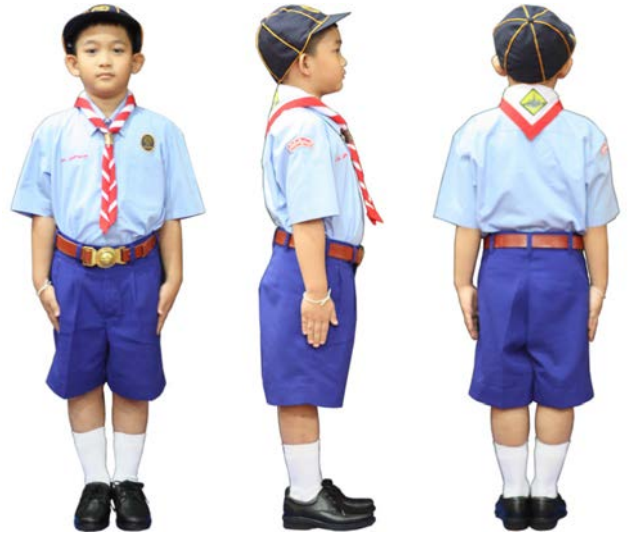
เครื่องแต่งกายลูกเสือสำรอง ชั้นประถมศึกษาปีที่ 1 - 3