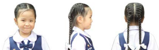
ทรงผมผู้หญิง ชั้นประถมศึกษาปีที่ 1 - 3