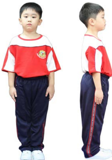
เครื่องแต่งกายชุดพลศึกษา นักเรียนชาย ชั้นประถมศึกษาปีที่ 1 - 3