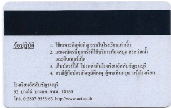
ตัวอย่างบัตรด้านหลัง