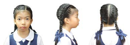
ทรงผมผู้หญิง ชั้นประถมศึกษาปีที่ 4 - 6