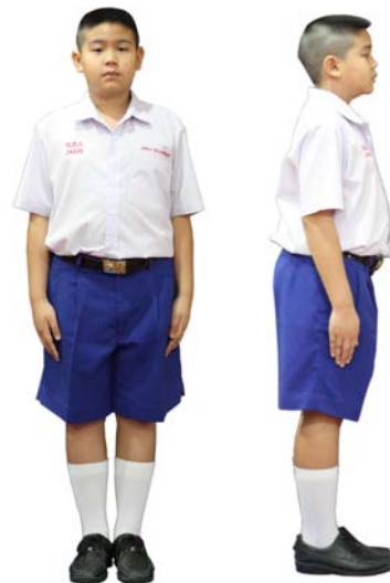
เครื่องแต่งกายชาย ชั้นประถมศึกษาปีที่ 4 - 6