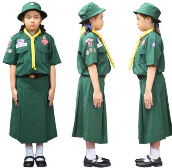
เครื่องแต่งกายเนตรนารีสามัญ ชั้นประถมศึกษาปีที่ 4 - 6