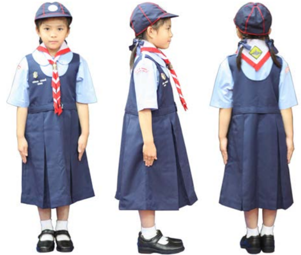
เครื่องแต่งกายเบตนารีสำรอง ชั้นประถมศึกษาปีที่ 1 - 3