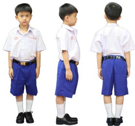
เครื่องแต่งกายชาย ชั้นประถมศึกษาปีที่ 1 - 3

1.6 ทรงผม ทรงนักเรียน ทรงอเมริกัน หรือ รองทรง (ตีนผมด้านข้างและด้านหลังต้องตัดให้ติดหนังศีรษะ ห้ามไว้จอนหรือปล่อยตีนผมแบบรอกไทร ส่วนยาวของผม ด้านหน้าต้องไม่ยาวเกินระดับคิ้วลงมา และห้ามใส่น้ำมันหรือเครื่องสำอางใดๆ