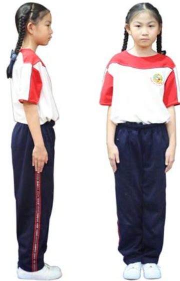
เครื่องแต่งกายชุดพลศึกษา นักเรียนหญิง ชั้นประถมศึกษาปีที่ 4 - 6