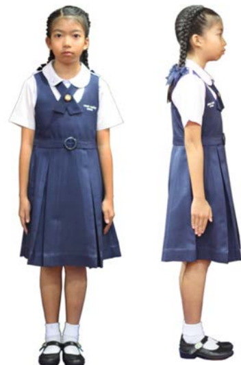
เครื่องแต่งกายผู้หญิง ชั้นประถมศึกษาปีที่ 4 - 6