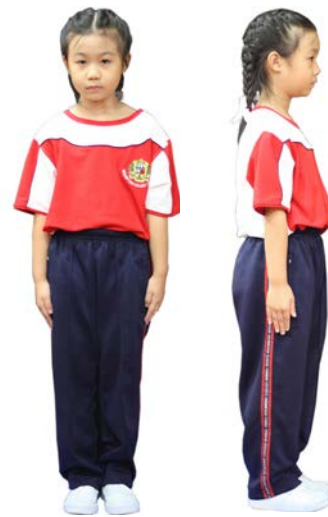
เครื่องแต่งกายชุดพลศึกษา นักเรียนหญิง ชั้นประถมศึกษาปีที่ 1 - 3