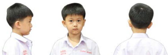
ทรงผมชาย ชั้นประถมศึกษาปีที่ 1 - 3