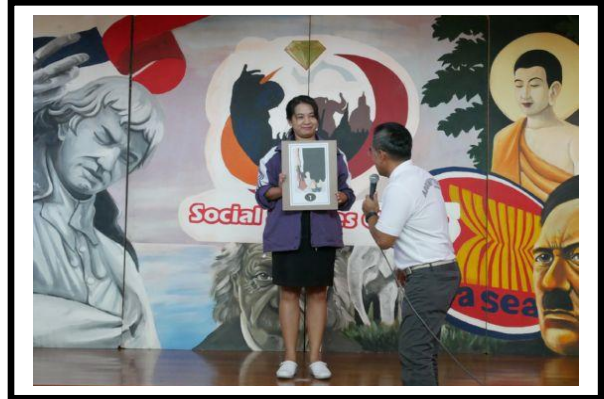
ภาพตัวอย่างการแข่งขันกิจกรรมแพนพังก์แท้ หัวข้อ “ประวัติศาสตร์อัสสัมชัญธนบุรี”