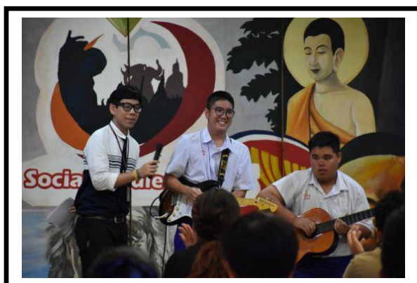
ภาพตัวอย่างการแข่งขันกิจกรรมแฟนพันธุ์แท้ หัวข้อ “กีตาร์ไฟฟ้า”

ที่นักเรียนสามารถแสดงออกซึ่งความสามารถทางดนตรีทั้งภาคปฏิบัติ (เล่นเพลงจริง ๆ) และภาคทฤษฎี (เกมคำถามในกิจกรรม) ต่อผู้เข้าชมกิจกรรมแฟนพันธุ์แท้ หัวข้อดังกล่าว